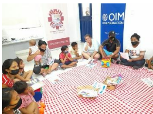
OIM: Picnic literario en el marco de la celebración del día internacional del libro centro de atención al refugiado y migrante.