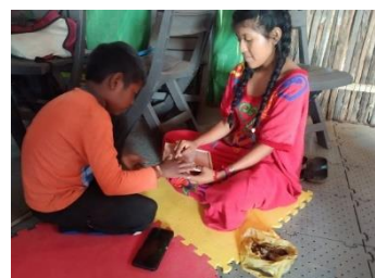
Save the Children Promoviendo el desarrollo de habilidades lógicas en niños, niñas y jóvenes, para la solución de problemas mediante la programación, a través la plataforma Scratch, Mlock, Tinker - cad

ORGANIZACIONES: Save the Children | UNICEF (Clickarte*, CIDEMOS * World Vision) | WFP (Frutos y verduras de mi país*, Fundación Manos Unidas por Amor*) | World Vision