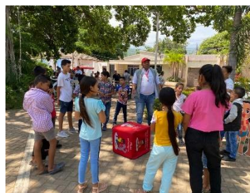
Save the Children: Actividades lúdicas para la prevención e identificación de situaciones de riesgo de protección de niñez en comunidades y ferias de servicios del departamento.