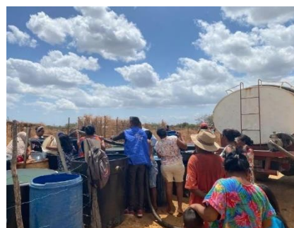
BAYLOR: Entrega de 18.000 litros de agua beneficiando aproximadamente a 1.073 familias de la población objeto