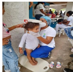
ACH: Tamizajes nut y toma de perímetro braquial para la identificación de niños en desnutrición