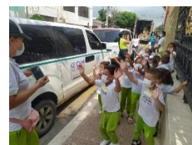
OIM: Apoyo en transporte para casos de integración desde las instalaciones del CDI hasta la casa de la cultura y biblioteca municipal de Maicao.