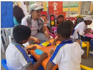
Save the Children: Feria de actividades lúdicas con mensajes de promoción de DDHH de niñez y apoyo psicosocial en Maicao, con ocasión al día del niño y en articulación con Secretaría de Educación Municipal. capacidades y potencialidades, para lograr