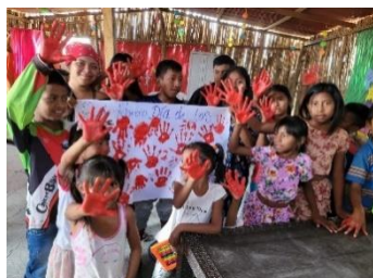
Save The Children: espacios de formación de padres, madres y cuidadores entorno a temáticas que les posibiliten reconocer la importancia de su participación en los procesos educativos y tengan las herramientas necesarias para que puedan apoyar los procesos

Entre los meses de enero y abril, 14.352 personas recibieron asistencias por parte de 4 socios principales y 4 socios implementadores del GIFMM La Guajira. El 42% de los beneficiarios se encuentran en el municipio de Maicao, el 14% en Uribia, el 9% en Fonseca y el 35% restante en Riohacha, Manaure, San Juan del Cesar, Dibulla, Barrancas, Distracción, Urumita, El Molino, Albania, Villa Nueva, Hato Nuevo y La Jagua del Pilar. Las acciones de este sector se concentran principalmente en: 3.028 refugiados y migrantes inscritos en instituciones educativas formales o inscritos en actividades / programas de educación alternativa o no formal, 8 refugiados y migrantes matriculados en instituciones educativas formales o programas de educación no formal que completan el ciclo educativo correspondiente y se matriculan en el siguiente nivel educativo y 11.317 niños, adolescentes o jóvenes los cuales fueron apoyados con suministros o servicios.