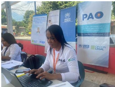
ACNUR: Servicios de atención y orientación durante una jornada de atención integral en Mingueo.