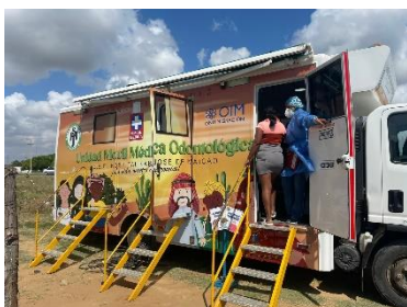
Unidad móvil Maicao alianza OIM hospital San Jose- asentamiento la pista en Maicao