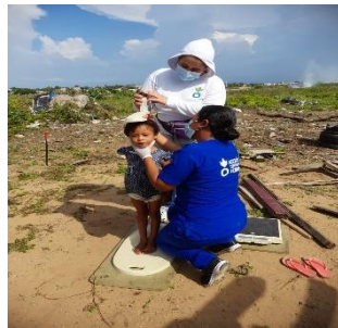
ACH: Tamizajes nut y toma de perímetro braquial para la identificación de niños en desnutrición

Entre los meses de enero y abril, 35.472 personas recibieron asistencias por parte de 8 socios principales y 2 socios implementadores del GIFMM La Guajira. El 37% de los beneficiarios se encuentran en el municipio de Maicao, el 30% en el municipio de Uribia, el 16% en el municipio de Riohacha y el 17% restante se encuentran en los municipios de Manaure, San Juan del Cesar, Dibulla, Distracción, Ható Nuevo, Fonseca, Villa Nueva, Albania y Barrancas. 34.252 refugiados, migrantes y miembros de comunidades de acogida afectadas recibieron asistencia alimentaria. 1.220 refugiados, migrantes venezolanos y población de acogida recibieron asistencia en los siguientes servicios: asesoramiento sobre la alimentación del lactante y niño/a pequeño/a (ALNP/IYCF), niños y niñas de 0 a 59 meses con desnutrición aguda (SAM y MAM) admitidos a tratamiento; y entrega de suplementos nutricionales a niños- niñas de 6 a 59 meses y mujeres embarazadas y lactantes.