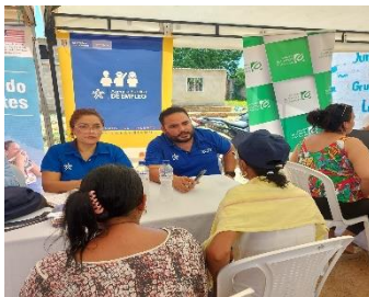
OIM: Feria de servicios con enfoque de empleabilidad en articulación con el centro integréate, con la participación de agencia pública del SENA, Cámara de comercio y agencia de empleo de caja de compensación Comfaguajira, generando espacios de atención a la población migrante y acogida del barrio La Mano de Dios en el Municipio de Riohacha

Entre los meses de enero y abril, 97 personas refugiadas, migrantes y miembros de la comunidad de acogida recibieron asistencias por parte 5 socios principales y 2 socios implementadores del GIFMM La Guajira. El 77% de los beneficiarios se encuentran en el municipio de Riohacha y el 23% se encuentra en Maicao. Estas personas fueron apoyadas para poder acceder a oportunidades de empleo o para poder mantener su empleo y así mismo fueron apoyados con actividades de inclusión y educación financiera.