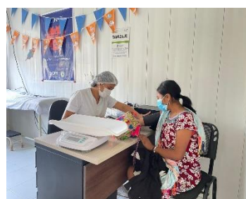
OIM salud: caracterización puesta de salud Paraguachon