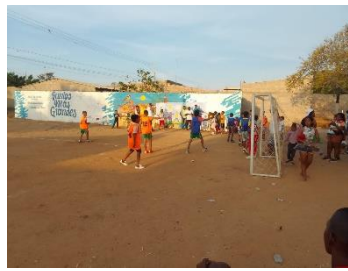
OIM: Celebración día del niño, se realiza actividades lúdicas deportivas y recreativas que convoquen a espacios de integración entre la comunidad La Mano de Dios comuna 10, en la mitigación de la xenofobia