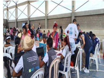
ACNUR: Jornada de atención integral en Uribia.