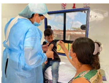
OIM: atención crecimiento y desarrollo- unidad móvil medico odontológica

Entre los meses de enero y abril, 37.262 personas recibieron asistencias en salud por parte de 14 socios principales y 4 socios implementadores del GIFMM La Guajira. El 44% de los beneficiarios se encuentran en el municipio de Riohacha, el 32% en el municipio de Maicao, el 22% en el municipio de Uribia y el 2% restante en los municipios Fonseca, Manaure, Dibulla, Distracción, Barrancas y San Juan del Cesar. 4.756 personas fueron asistidas con dosis de vacunas administradas según ciclo de vida y calendario nacional, 26.207 personas asistidas con consultas de atención primaria en salud, 4.961 refugiados y migrantes de Venezuela asistidos con vacunación contra la COVID_19, 1.338 refugiados y migrantes de Venezuela recibieron insumos.