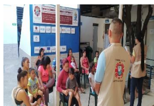
OIM-PASTORAL SOCIAL Socialización oferta de servicios básicos en el territorio.