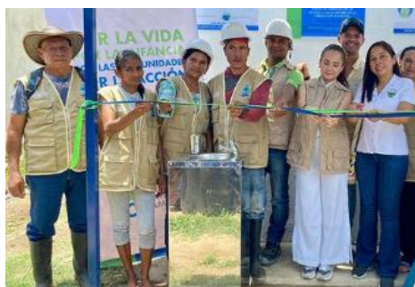
ACH: puntos de hidratación de agua apta para el consumo humano entregados en la vereda San Salvador en Dibulla.

En el primer cuatrimestre del año, 4.104 personas recibieron asistencia por parte de 8 socios principales y 1 socio implementador del GIFMM La Guajira. El 33% de los beneficiarios se encuentran en el municipio de Uribia, el 20% en Maicao, el 20% en Manaure, el 19% en Dibulla y el 8% en Riohacha. 3.176 fueron asistidos con acceso seguro a agua suficiente y potable (al menos a nivel de servicios básicos de agua, JMP Delft) y 928 recibieron suministros y servicios de higiene adecuados (mensajes, artículos, instalaciones), incluidas mujeres y niñas los cuales recibieron servicios de manejo de la higiene menstrual.