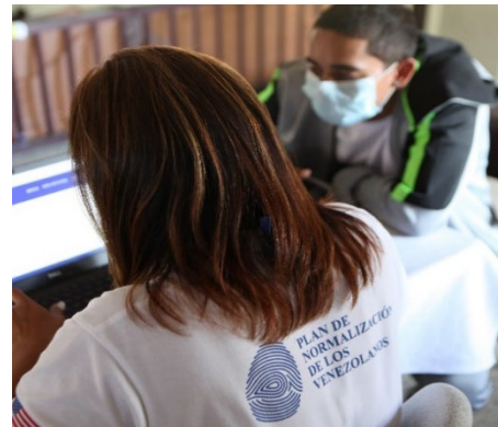
Una ventanilla del PNV, ©UNHCR/Juan C. González

Las ventanillas de apoyo, gestionadas por organizaciones de la sociedad civil lideradas por venezolanos en diversas comunidades del país, ofrecen a los venezolanos un acceso local para inscribirse en la Fase 1 y obtener apoyo en las fases posteriores, así como otros tipos de asistencia. Las ventanillas están coordinadas por el Presidente de la Cámara de Comercio Dominicano Venezolana, que también ayudó a conseguir el apoyo del sector privado en forma de locales para sus operaciones.