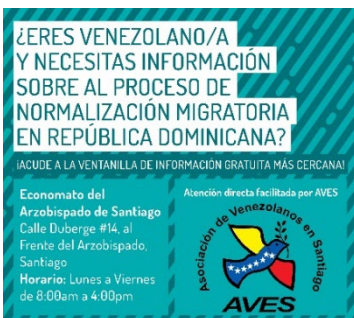
Anuncio en redes sociales por una ventanilla en Santiago

Antes del Plan de Normalización, los venezolanos en la RD debían regresar a Venezuela para poder solicitar visados que conferirían el estatus regular. En cambio, el Plan permite otorgar visados dentro del territorio dominicano y aceptar pasaportes caducados en el proceso. Esta resolución proporciona una mayor accesibilidad a la población a la vez que permite a los socios de R4V contribuir a la respuesta a la crisis humanitaria.