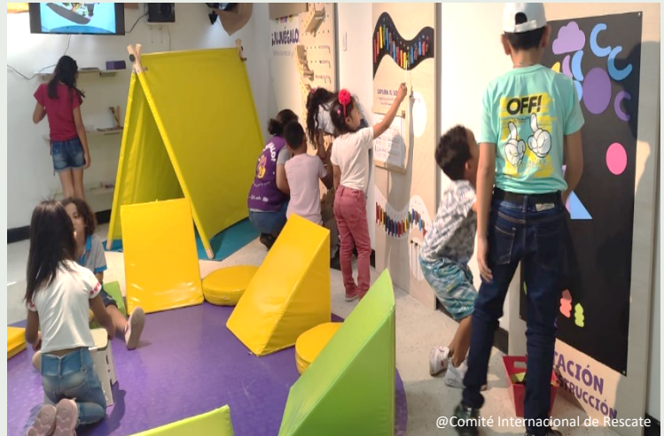
@Comité Internacional de Rescate

Su canción favorita es “Soy Una Serpiente” (Artista: El Reino Infantil), y su lugar favorito del espacio de juego es el nicho de la calma donde puede sentirse segura mientras colorea o pinta con diversos elementos. Su alimento favorito del refrigerio es el cambur (banano). Los sábados en su casa escucha junto con su familia “Al Aire con Enrique” programa radial que hace parte de JUJUEGALO y que se emite a las 9:00 am por caracolradio.com.co y wradio.com.co