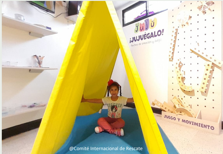
@Comité Internacional de Rescate

JUJUEGALO es un proyecto desarrollado en Colombia por el Comité Internacional de Rescate (IRC) en asocio con La Otra Juventud, aeioTU y Clack Educación. Hace parte de la iniciativa global de la Fundación LEGO Play Movement, que busca posicionar el aprendizaje a través del juego en contextos vulnerables, para que los niños y las niñas sean los protagonistas del cambio.