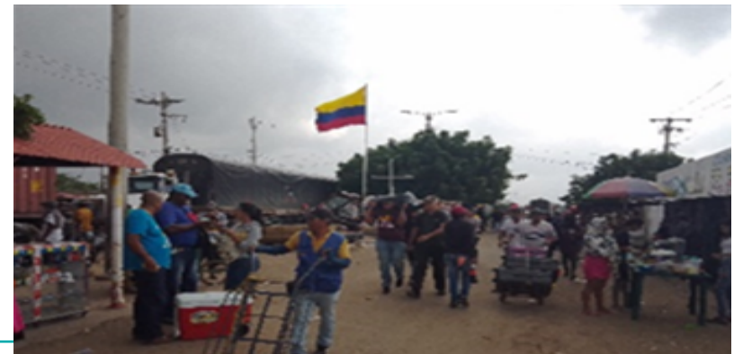
Aumento en las ventas ambulantes y aumento moderado en los flujos.