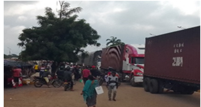
Gran volumen de intercambio comercial.

Debido al restablecimiento de las relaciones comerciales, se verá un incremento en riesgos de protección como trata y tráfico y la continuación del contrabando de gasolina.