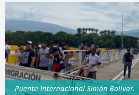
Puente Internacional Simón Bolívar.

Finalmente, debido a que el próximo 1 de noviembre del 2022 se dará el cierre del CAS de Los Patios, se prevén nuevos retos en la Ruta de Protección. Se contempla la posibilidad de ver más caminantes entre el trayecto del CAS de Los Patios y la Don Juana, este incremento podrá desbordar las capacidades de los Puntos de La Don Juana y Hermanos Caminantes, en especial en el Sector de Alojamiento y Transporte Humanitario. Para evitar ese desbordamiento el GIFMM local estará trabajando en un taller para hacer redistribución de los servicios que se prestaban en Los Patios.