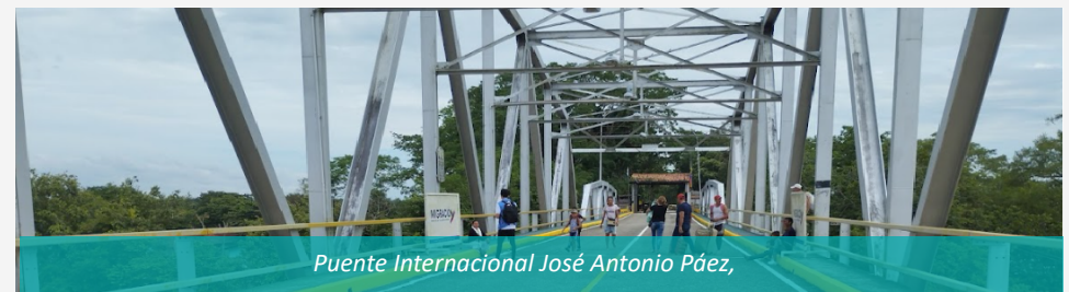
Puente Internacional José Antonio Páez,

Adicionalmente, se percibe confianza en la población en tanto mejoren las condiciones del único paso formal de esta zona de frontera, esto podría tener un impacto positivo en las zonas aledañas pues envía un mensaje de seguridad a través de la recuperación de espacios en los sectores ubicados en inmediaciones del puente que hoy son considerados “altamente peligrosos”.