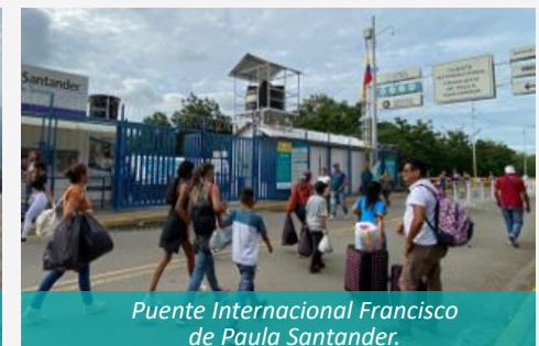
Puente Internacional Francisco de Paula Santander.