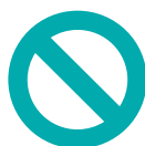
Despojo de la vivienda