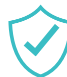
Medidas de protección