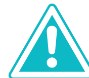
Riesgo de abandono de la vivienda