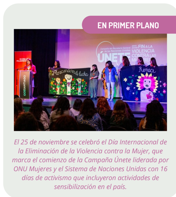
El 25 de noviembre se celebró el Día Internacional de la Eliminación de la Violencia contra la Mujer, que marca el comienzo de la Campaña Únete liderada por ONU Mujeres y el Sistema de Naciones Unidas con 16 días de activismo que incluyeron actividades de sensibilización en el país.