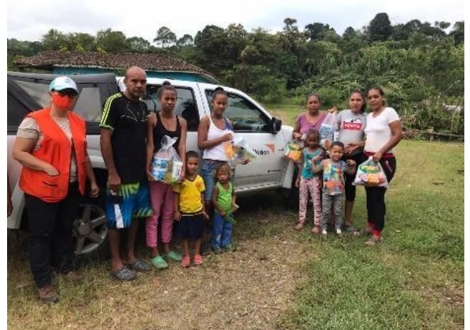
Entrega de kits de higiene y elementos de bioseguridad a familias venezolanas en zona rural de Yumbo.

Sigue la identificación de beneficiarios con necesidades alimentarias para la entrega de kits alimentarios familiares y bonos alimentarios.