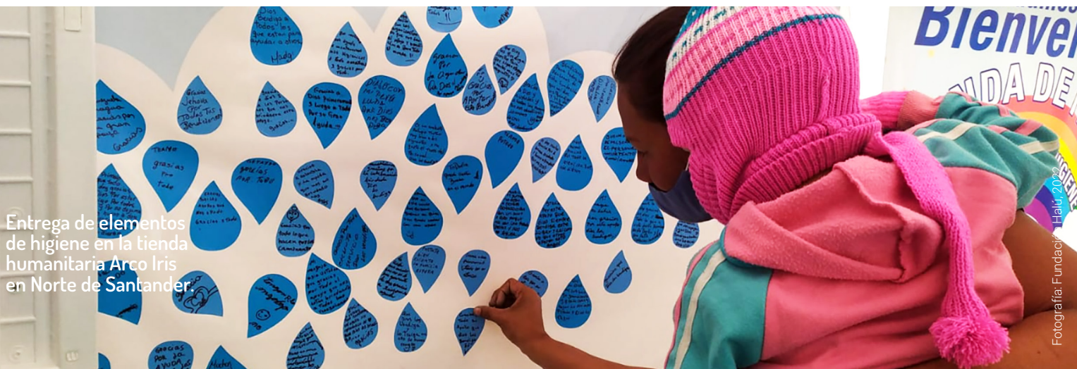
Entrega de elementos de higiene en la tienda humanitaria Arco Iris en Norte de Santander.