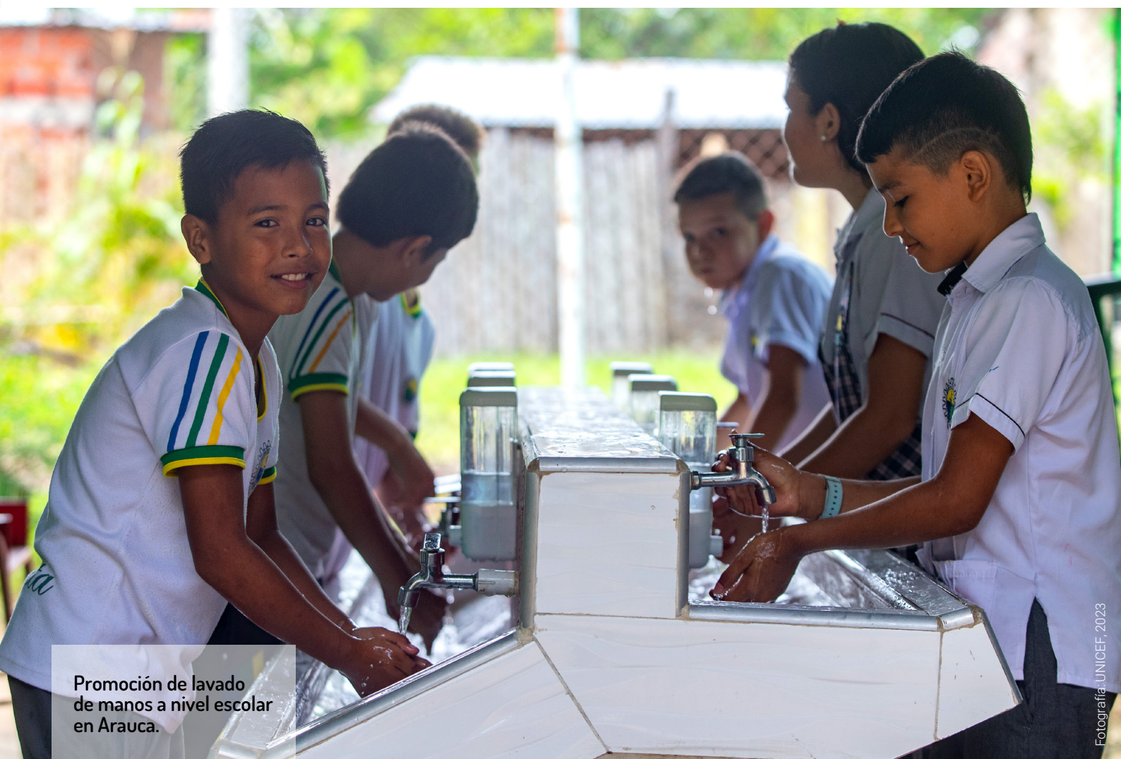
Promoción de lavado de manos a nivel escolar en Arauca.

Para maximizar el éxito de estas acciones, es necesaria implementar el monitoreo y la evaluación del aprendizaje, reconocer y resaltar los avances o cambios, como refuerzos positivos para aumentar la probabilidad de que las conductas se mantengan y sean replicadas, así como demostrar con evidencia los beneficios al cuidar de la salud, fortalecer los vínculos familiares y comunitarios y promover valores y deseos que contribuyan a la cohesión social (solidaridad, confianza y sentido de pertenencia).