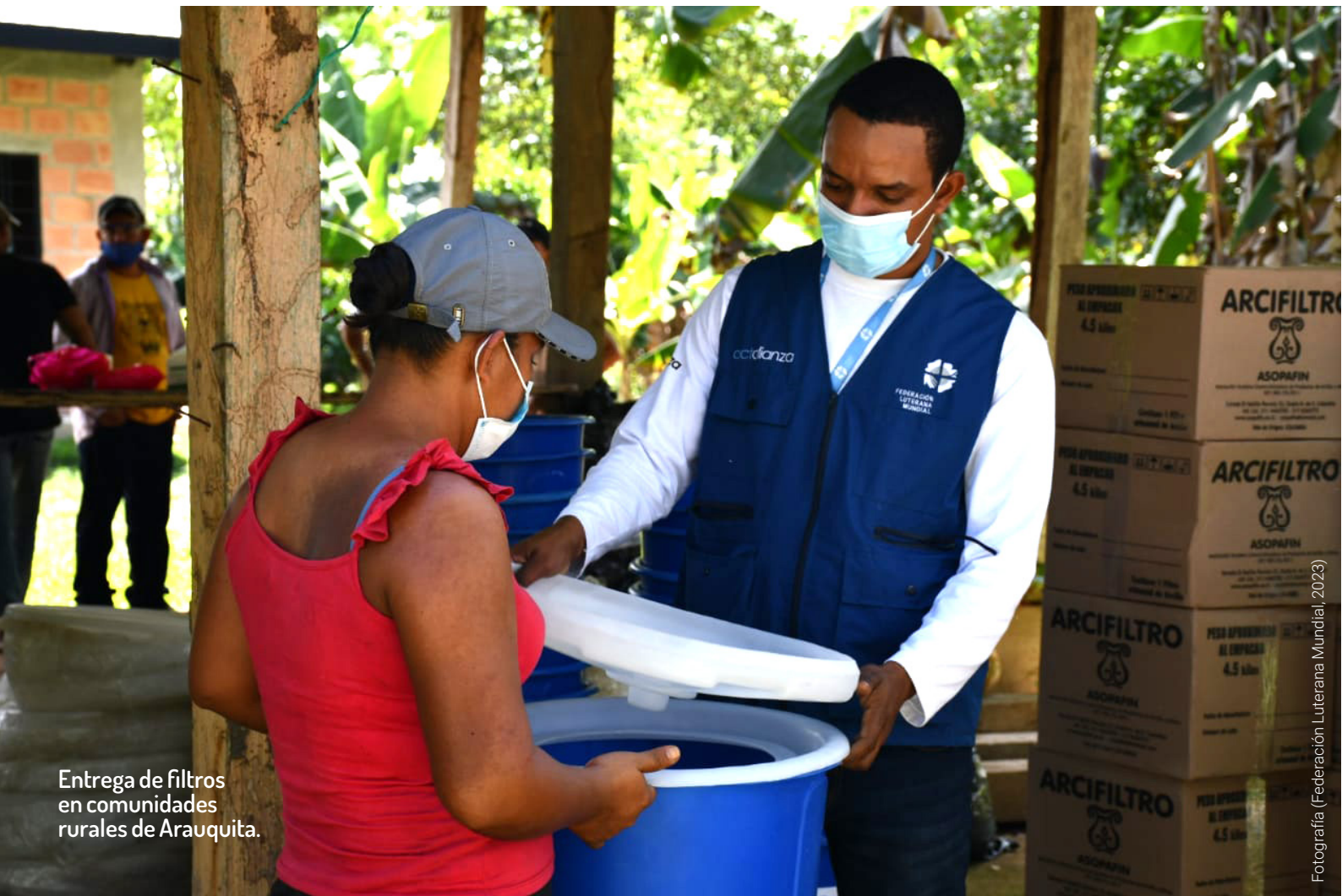
Entrega de filtros en comunidades rurales de Arauquita.