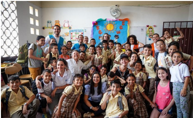
Foto: Acompañamiento del sector de educación para atender necesidades identificadas. Norte de Santander.

El sector de Educación coordinó la respuesta de los socios a nuevas solicitudes de apoyo de las secretarías de educación locales para la entrega de insumos educativos, apoyo técnico a funcionarios y soluciones educativas a distancia para niños, niñas y adolescentes. Los socios también apoyaron con el mejoramiento de la infraestructura de instituciones educativas, a través de la adecuación y reparación de espacios para ampliar la atención y cupos a NNA, de otro lado se dio alcance a padres, cuidadores, maestros y funcionarios con formaciones para aumentar sus habilidades para apoyar el aprendizaje y el bienestar de los NNA refugiados y migrantes venezolanos.