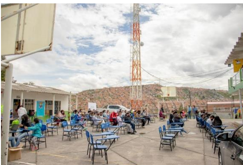
Foto: 1. Municipio de Soacha. Jornada de acción Humanitaria. Entrega de insumos a NNA migrantes. Acompañamiento del sector de educación para atender necesidades identificadas. 2021

El sector de Educación centró sus esfuerzos en mejorar las condiciones de inicio de año escolar e ingreso al sistema educativo para niños, niñas y adolescentes refugiados y migrantes a través de acompañamiento de la prestación del servicio de educación en casa y en presencialidad bajo el esquema de alternancia, y de igual manera para la posterior reapertura de las instituciones educativas. Además, se realizaron entregas de insumos educativos, alimentación escolar y apoyo socioemocional contemplando las afectaciones por la pandemia y las situaciones de orden público de algunos territorios.