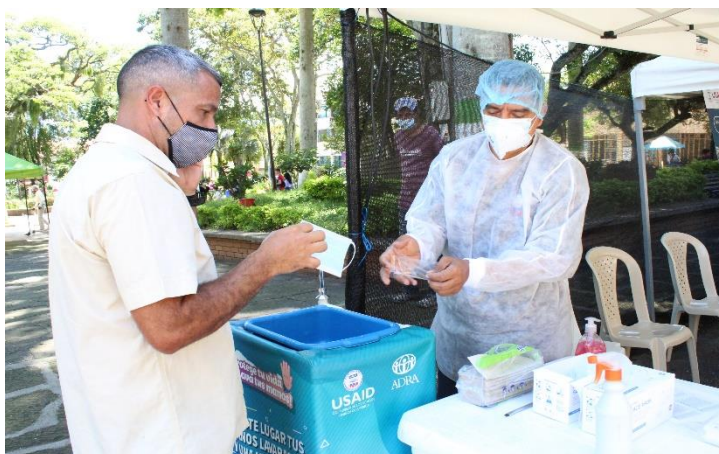
Lavado de manos y cambio de tapabocas, cada vez que los participantes llegan hasta el lugar donde se encuentra la Unidad Móvil Médica, se realiza el lavado de manos y el cambio de tapabocas con el fin de prevenir la propagación del virus, y cuidar de la salud de quienes asisten al servicio médico. Lugar: municipio San Gil – Santander. ADRA