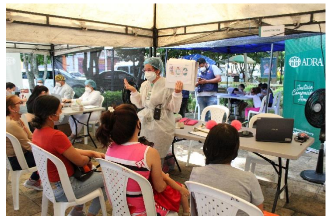
Participantes recibiendo la capacitación sobre el Covid-19, en este espacio se les explica los síntomas, y las medidas preventivas de autocuidado que se deben poner en práctica. Lugar: municipio San Gil – Santander. ADRA.