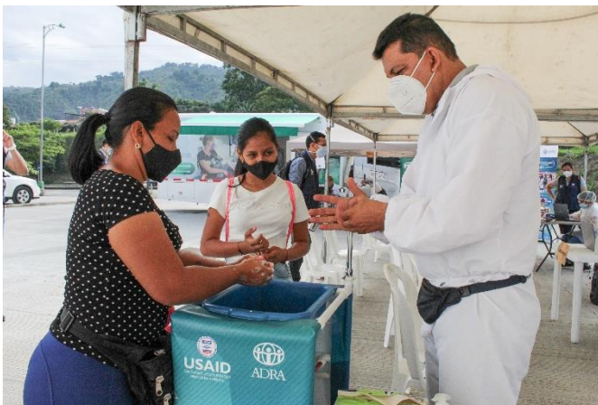
Indicación y lavado de manos a participante del proyecto. Lugar: municipio Piedecuesta – Santander. ADRA

En Ipiales , en el departamento de Nariño, se asistió a población migrante para el acceso seguro a instalaciones sanitarias con el mejoramiento a letrinas comunitarias. En Arauquita , se realizó la instalación de infraestructura para el lavado de manos para adultos y para niños, niñas y adolescentes – NNA, así como también estaciones para el lavado de ropa al interior de los albergues.