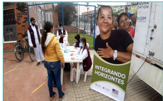
Foto 2. Proceso de caracterización y registro de la población refugiada y migrante en el proyecto Integrando Horizontes de FUPAD.