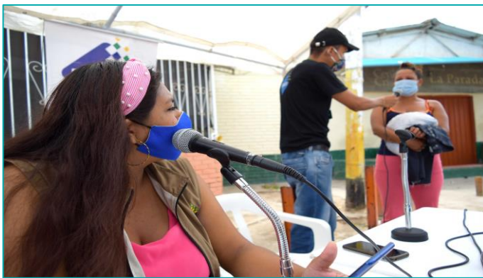
Foto 1. Proyecto de radio comunitaria “La Parada” desarrollado en Vila del Rosario, Norte de Santander por UNICEF.

Finalmente, en relación con inclusión financiera , 1.519 beneficiarios fueron alcanzados en 2 departamentos: Norte de Santander y La Guajira. Es de destacar que en el primer departamento se realizaron capacitaciones en educación financiera a mujeres madres, para la gestión y aprovechamiento de los recursos que ingresen a sus hogares.