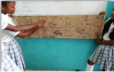
Encuentro de caracterización de niñas de la Institución Educativa de Espriella – Tumaco