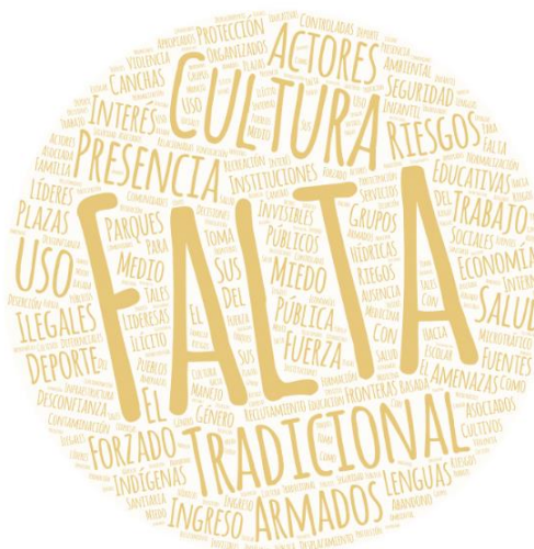
Necesidades identificadas por las pueblos indígenas y las comunidades afrocolombianas