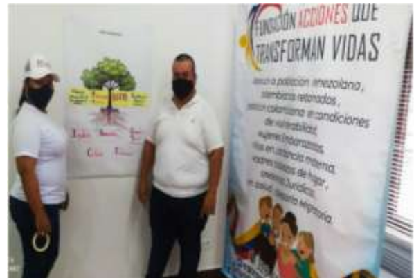
Líder comunitario del proyecto "Fortalecimiento institucional y comunitario para las acciones en salud de la población refugiada y migrante venezolana, colombianos retornados y comunidad de acogida".

Se continuó el apoyo y fortalecimiento a Empresas Sociales del Estado (E.S.E.) prestadoras de servicios de salud de la Secretaría de Salud Pública Municipal de Cali, con entrega de insumos médicos, dotaciones de equipos médicos, medicamentos, materiales de limpieza, higiene y bioseguridad, enrutamiento por vía telefónica a la población refugiada y migrante para acceso a servicios de salud.