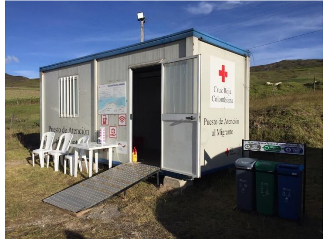
Puesto de Atención al Migrante (PAM) - Páramo de Berlín.

Finalmente, desde la Secretaría de Desarrollo Social de Bucaramanga se gestionó la donación de 500 almuerzos diarios para ser entregados los martes y jueves al medio día a refugiados y migrantes y población vulnerable en diferentes puntos de la ciudad, para lo cual se solicitó apoyo a los socios del GIFMM en materia de transporte y logística para recoger y entregar estas ayudas.