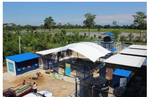
Espacio de Apoyo de La Unión. Puerto Santander