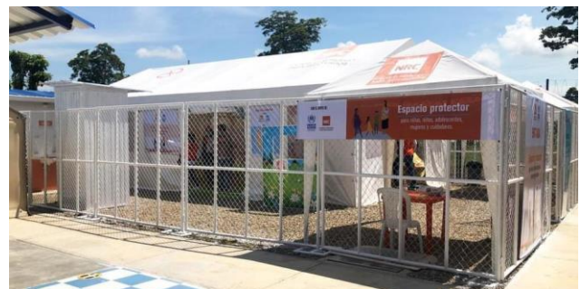
Espacio Protector en el Espacio de Apoyo de La Unión, Puerto Santander / NRC.

Por otro lado, entró en funcionamiento el Espacio de Apoyo en La Unión, Puerto Santander, una iniciativa liderada por La Gobernación de Norte de Santander, la Alcaldía Municipal de Puerto Santander, el Instituto Departamental de Salud, la ESE Hospital Regional Norte y algunos socios del GIFMM. Este espacio, con capacidad para 40 personas diarias, estará brindando servicios de atención primaria en salud, nutrición, apoyo psicosocial, consulta de enfermería para anticoncepción, control prenatal integral y vacunación, también se brindarán servicios de referenciación, orientación y asesorías jurídicas, existe un espacio protector para niños, niñas y adolescentes y servicios de agua y saneamiento básicos para la población.